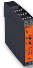
Sicherer sensorloser Stillstandswächter UG 6946